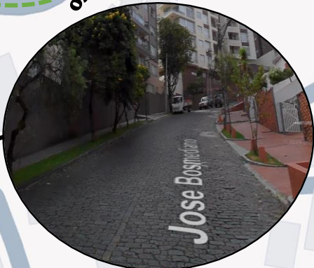
INTERVENCIÓN SOBRE EL TRAMO DE PIEDRA DE LA CALLE JOSÉ BOSMEDIANO